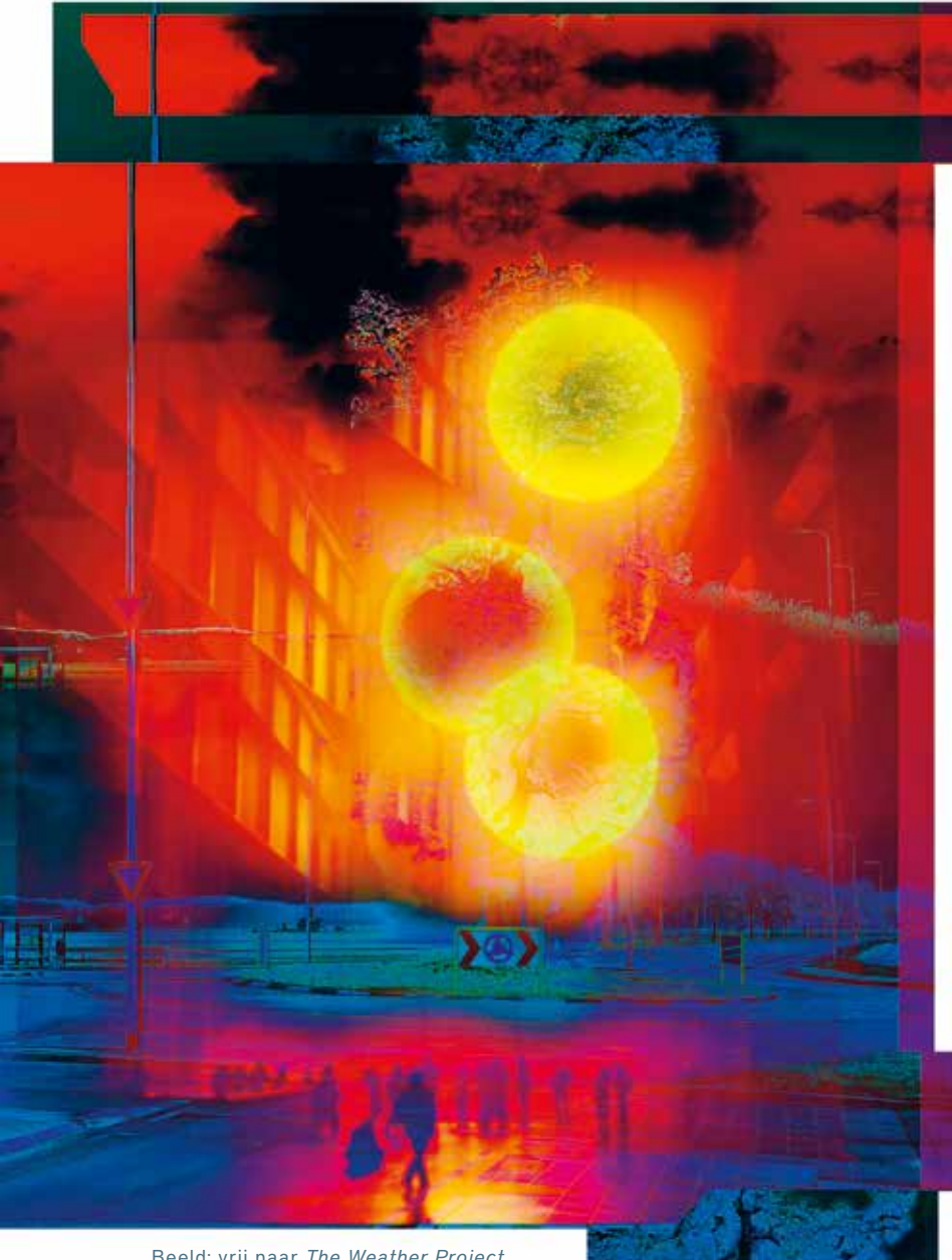
Beeld: vrij naar The Weather Project