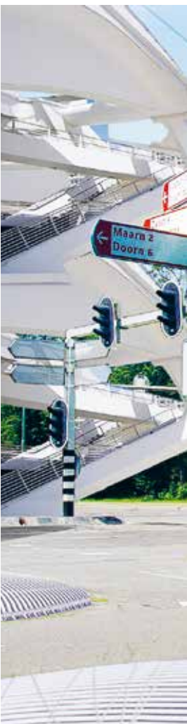
Beeld: vrij naar het werk van architect Santiago Calatrava