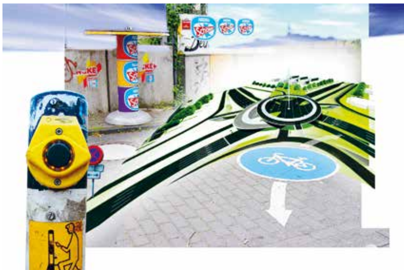
Beeld: vrij naar de zwevende fietsrotonde van ipv Delft